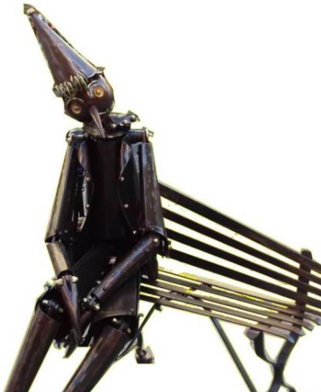
Pinocchio , 2016, ferro battuto, 170 x 80 x 70 cm

Maiori (Sa) - Cell. 3314114920 - www.ferroautore.it - Email: info@ferroautore.it