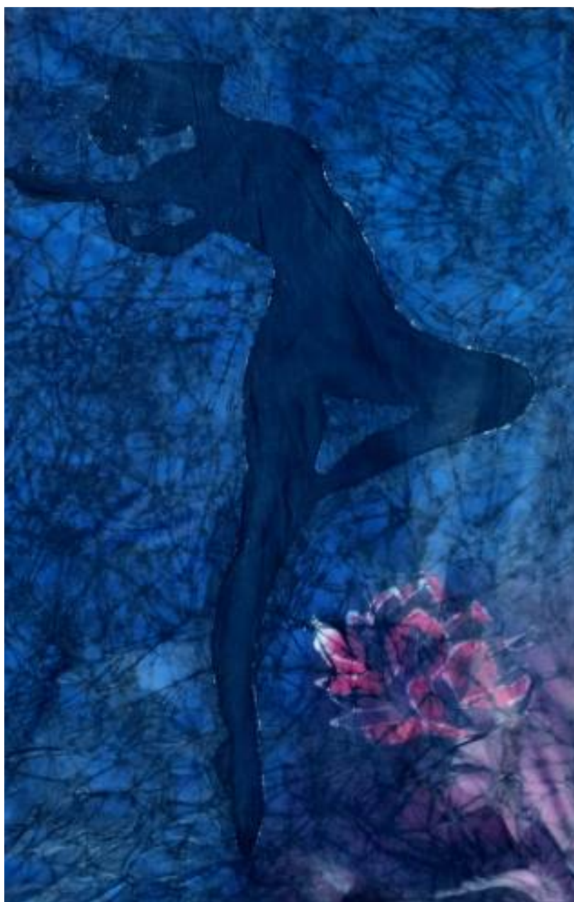
La danza del loto, 2021, batik, 120 x 80 cm