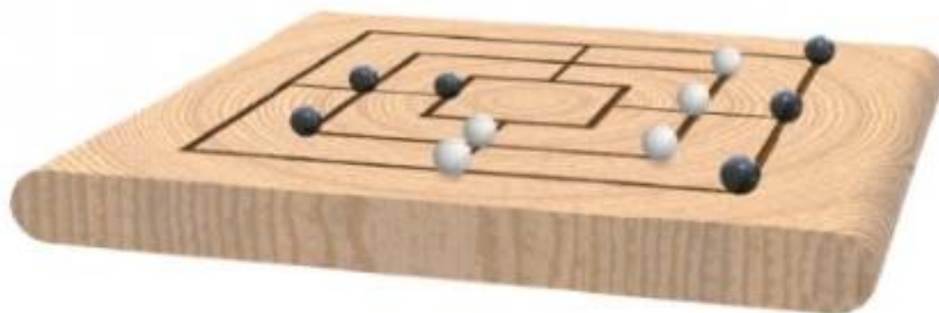
Fondago dei Tedeschi , 2021, mista, cm 12 x 20 x 2