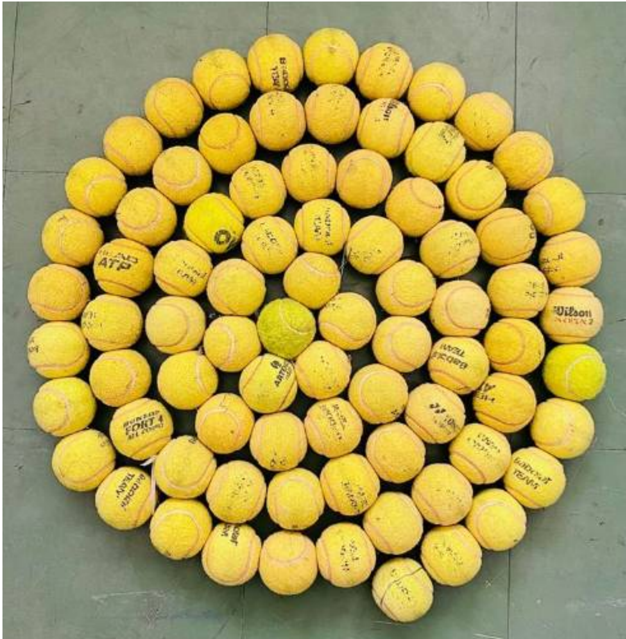
Tappeto di palline , 2017, 81 palline da tennis, cm 65 implementabile

Messina - Cell. 3282066948 - www.lischi2000.it - Email: lischi2000@yahoo.it