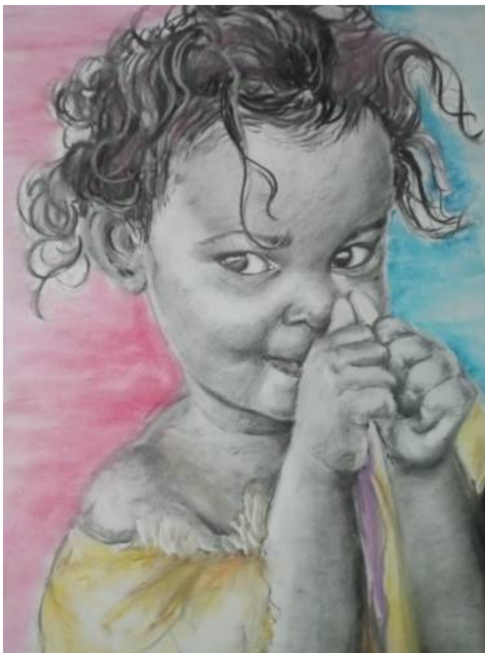
Giochi , 2021, matite colorate e carboncino su foglio liscio, cm 33 x 48

Cava De' Tirreni (SA) - Cell. 3738836465 – Email: kettisiani@gmail.com