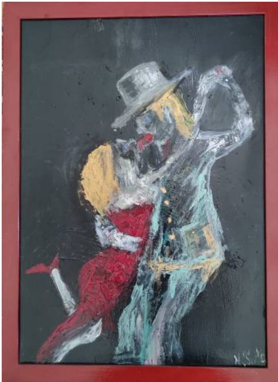
Ballare , 2016, acrilico su tela, 50 x 70 cm