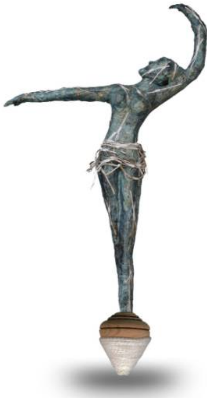
Giochi perduti , 2021, tecnica mista , 180 x 90 cm

Foglianise (BN) - Email: dariabollo.art@gmail.com