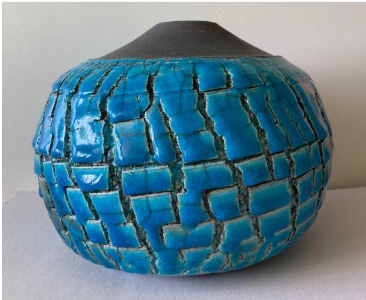
Terra crepata , 2021, grès , 16 x 20 cm

Carife (AV) - Cell. 3396103431 - www.brancaterrasinfiamma.it - Email: gaetano.branca@libero.it