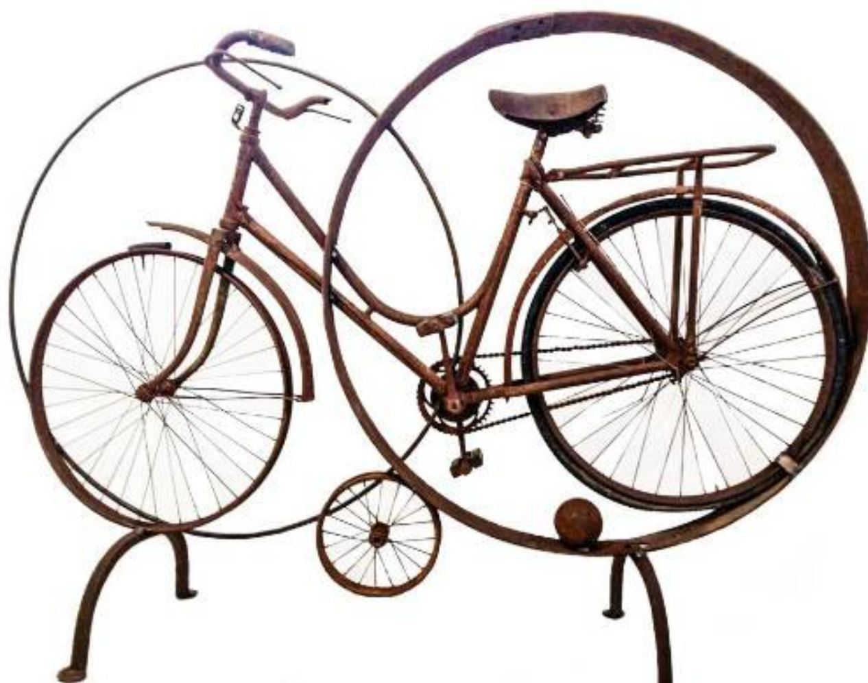
Senza titolo , 2018, assemblaggio di materiali vari, dim. cm 150 x 30

Benevento – Cell. 3398085881 - Email: iemily@alice.it