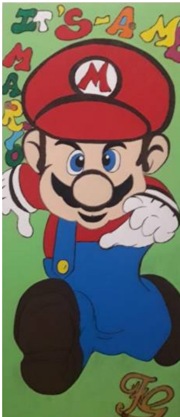
La Mascotte, 2020, acrilico su legno, 70 x 35 cm