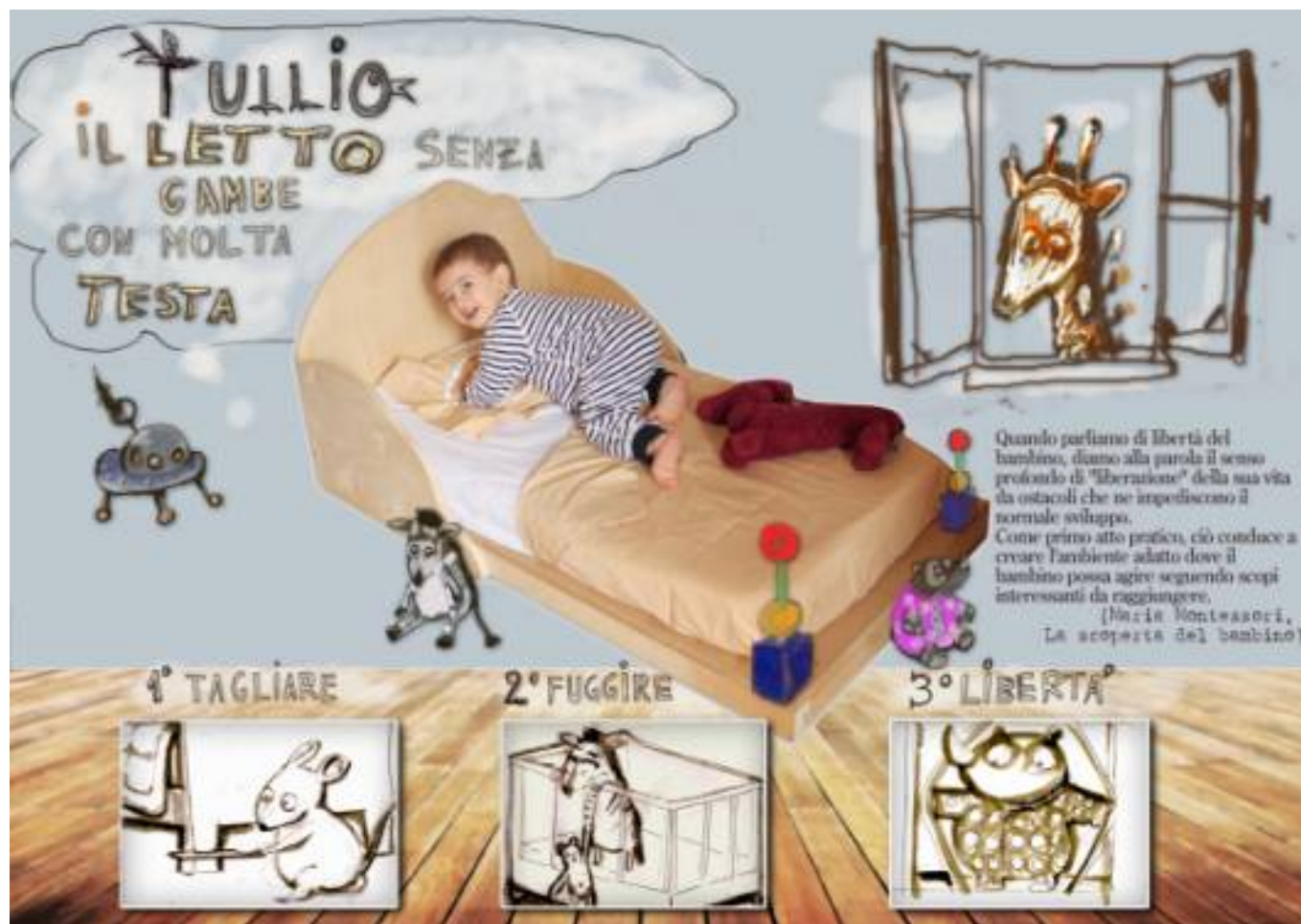
Tullio il letto senza gambe, 2020

Treviso - Cell. 3337246612 - Email: gaionroberta@gmail.com