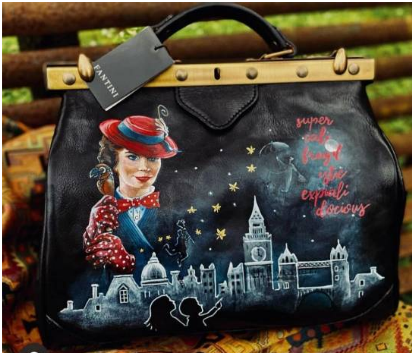
Mary Poppins 2020, borsa decorata a mano , 32 x 20 x 21 cm

Massa (MS) - Cell. 329 294 5785 - www.manolacaribotti.it - Email: manolacaribotti@gmail.com