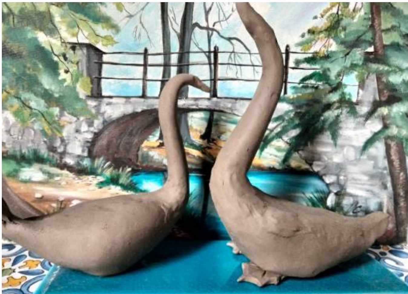
Fischietto , 2021, argilla, 16 x 10 cm

Pratella (CE) - Cell. 3291990751 - Email: testa.antonio22@hotmail.it