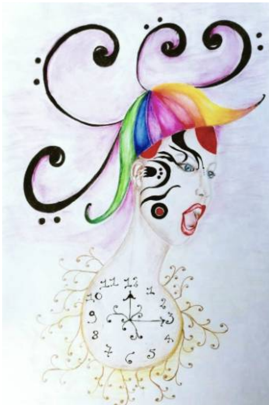
L'orologio Matto , 2021, pastelli secchi ed acquerellabili, inchiostro di china, cm 33 x 48

Cava De' Tirreni (SA) - Cell. 3401687750 - Email: sonorika1971@gmail.com