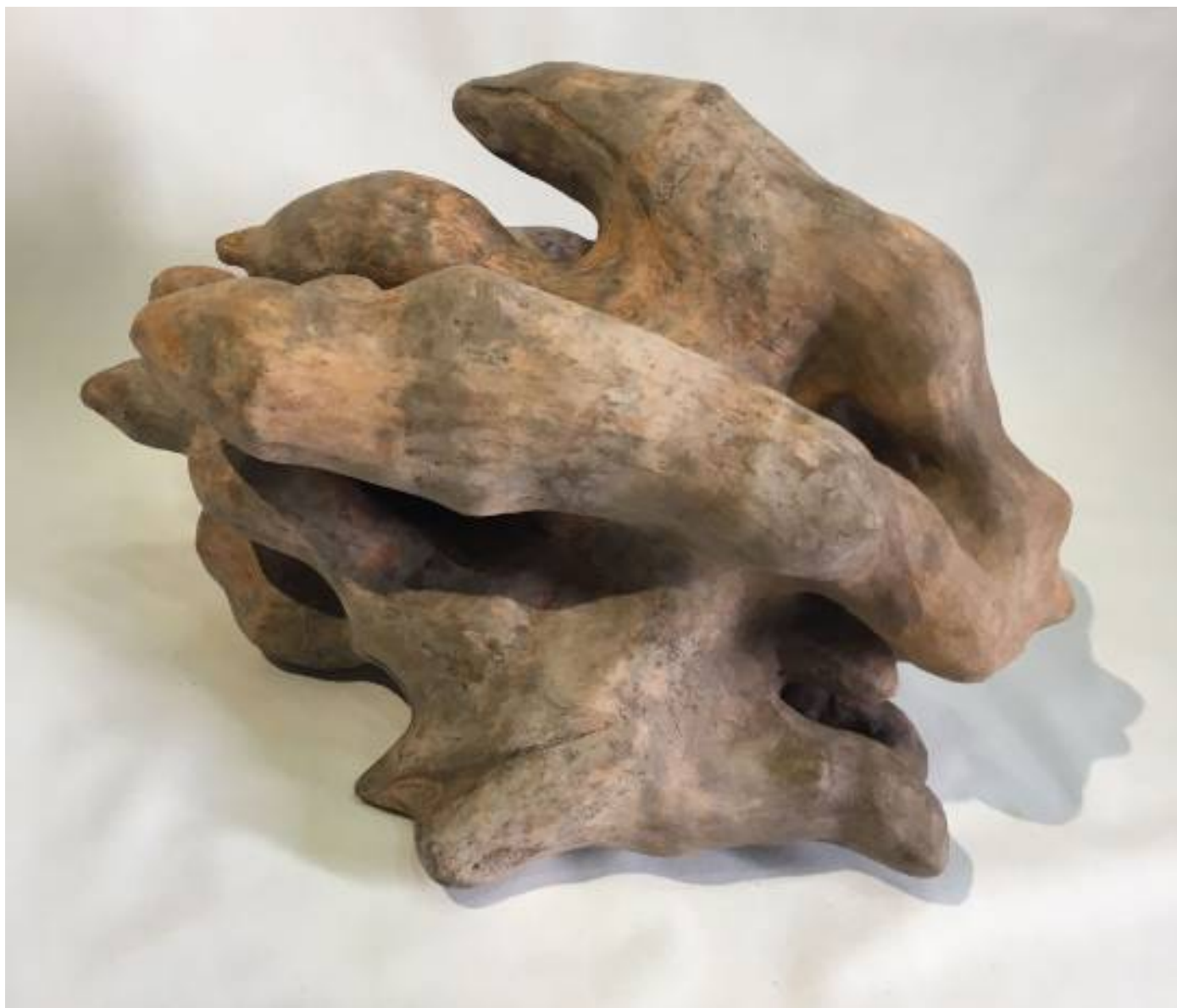
Vulnera , 2021, ceramica, 40 x 35 x 38 cm

Guardia Sanframondi (BN) - Cell. 3388029308 - Email: carmine@maffeiccart.it