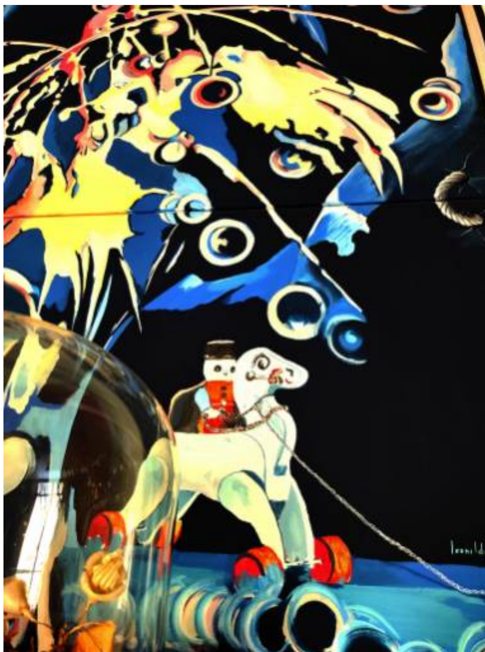
Gioco , 1979, olio su tela , 140 x 90 cm

S. Giorgio del Sannio (BN) - Cell. 3477284172 - Email: leonildo@leonildobocchino.it