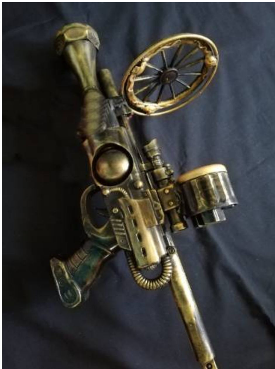
Pistola fantascienza , 2020, materiali vari, 42 x 38 x 6 cm