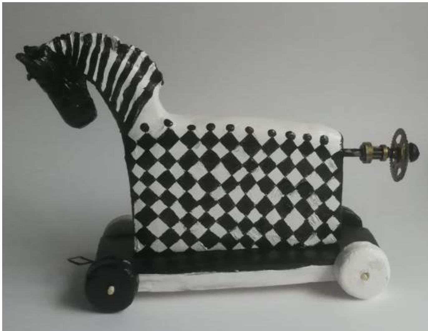
Mechanical toy , 2021, wax for wood, oil paints, alcohol inks, golden and silver leaves, cm 15 x 5.5 x 12

Warsaw - Tel. +48576032531 - Email: kasiapataraja@op.pl