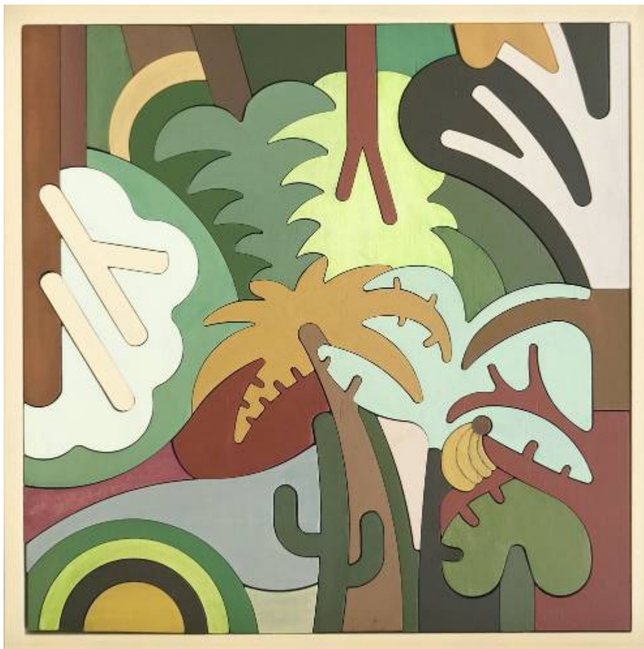
Forest Her , 2020, multistrato marino inciso al laser , 42 x 42 x 3,5 cm

Messina (ME) - Cell. 3395412069 - www.vimedesign.com - Email: vittoria.cigala82@gmail.com