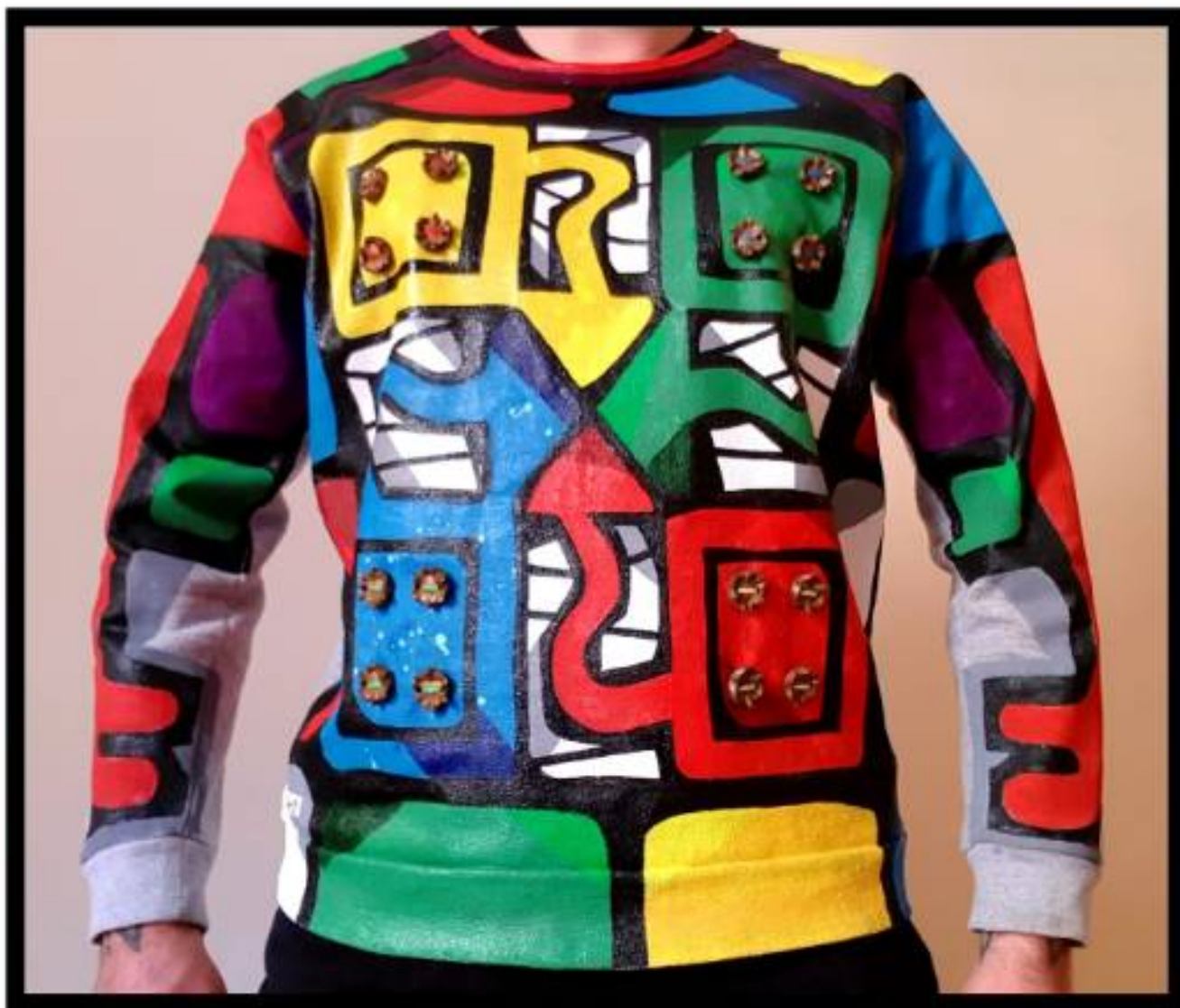
Felpa, 2021, decoro su stoffa

Irlanda - Tel. 00353-0861789191 - Email: caminosdegardel@gmail.com