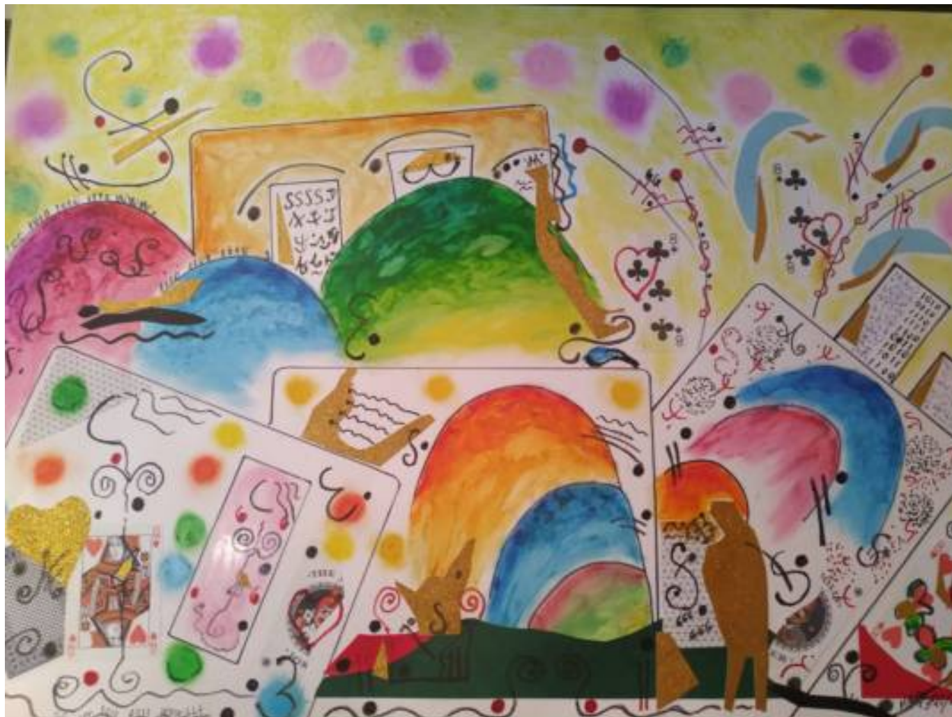
Città Multimediale , 2020, mista su tela, 50 x 70 cm

San Sebastiano al Vesuvio (Na) - Cell. 3924079560 - Email: elefante3@alice.it