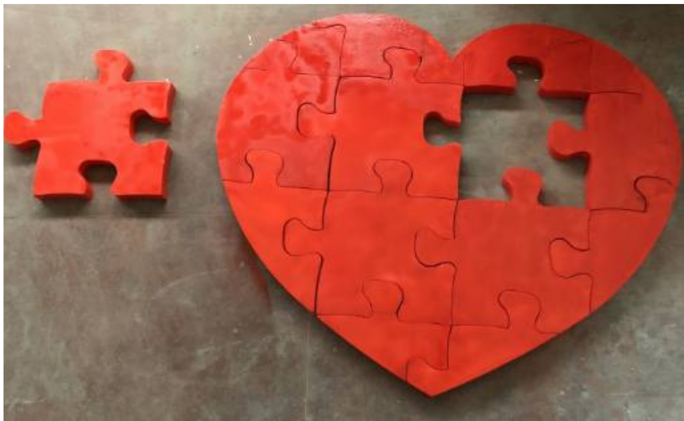
Puzzle , 2018, mista resina e smalti, 300 x 250 x 10 cm

Ponte (BN) - Cell. 347 5973707 - www.picarte.it - Email: info@picarte.it