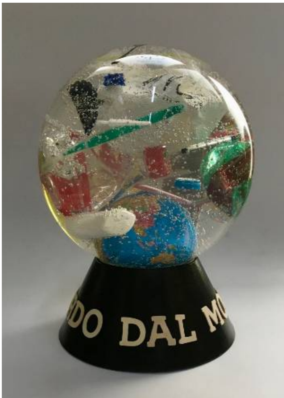
Ricordo dal mondo , 2019, tecnica mista , 41 x 30 cm

Napoli - Cell. 3409884069 - www.alessandro-borrelli.webnode.it - Email: borale1969@gmail.com